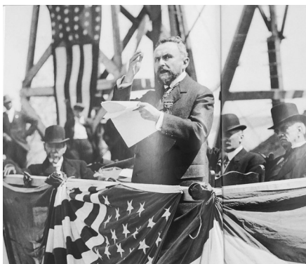
Etats-Unis. 3 mai 1912. Gabriel Hanotaux conduit la mission Champlain.

Il a paru intéressant d'associer ces deux personnalités, diplomates et intellectuels reconnus (historien, biographe de Richelieu pour l'un, écrivain spécialiste de littérature anglaise pour le second), en revenant sur leur vision du monde au tournant de la Grande Guerre , face au nouvel ordre mondial issu des Traités de Paix. Mais ce qui les a rapprochés, c'est aussi l'intérêt qu'ils ont manifesté pour le monde américain et leur action dans le cadre des relations transatlantiques , Jusserand comme ambassadeur de France à Washington, Hanotaux comme fondateur du comité France-Amérique.