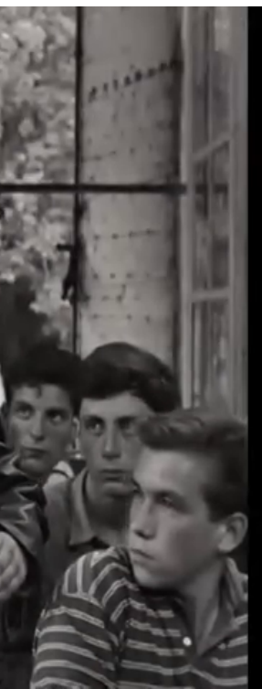
Les loups dans la bergerie, Hervé Bromberger, 1960